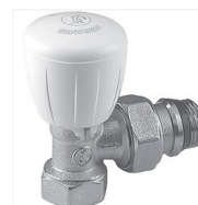
Robinet équerre thermostatisable R421TG