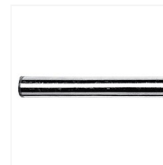
Tube de liaison chromé