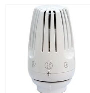
Tête thermostatique liquide R469 à fixation Clip-Clap