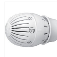
Tête thermostatique R470