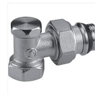
Coude de réglage R16TG