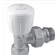
Robinet équerre thermostatisable R421TG