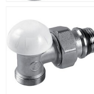
Coude de réglage R29TG