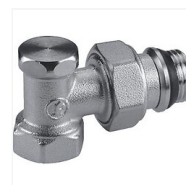
Coude de réglage R16TG