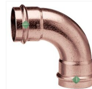
Coude cuivre 90° F/F à sertir Profipress