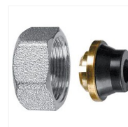
Raccord Keep à compression Cu