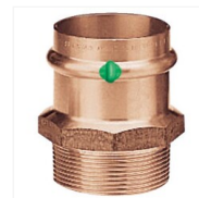
Mamelon femelle à sertir mâle à visser