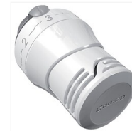
Tête thermostatique Senso