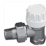
Corps de robinet équerre Senso EURO SAR 808