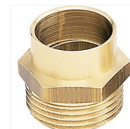
Manchon à souder mâle à visser 243GCU