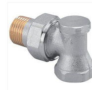
Coude de réglage nickelé SAR 3428