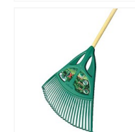
Balai à gazon et feuilles