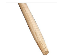
Manches de fourches à douille