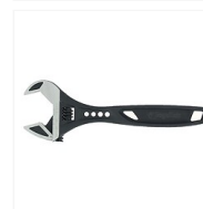
Clés à molette Molène