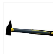
Marteau rivoir Taureau II