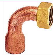
Raccord 2 pièces cuivre coudé femelle à souder femelle à visser 2A GCU