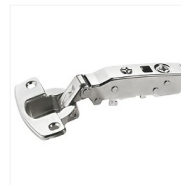
Charnières invisibles 110° amortisseur intégré - Sensys 8645i