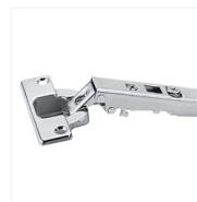
Charnière invisible 110° Intermat 9943