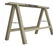
Tréteaux pliants hêtre