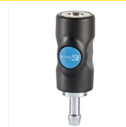
Raccords pour flexibles air comprimé ISI 06