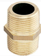
Mamelon laiton égal M/M à visser