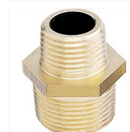
Mamelon réduit M/M à visser