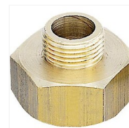
Mamelon laiton M/F réduit mâle