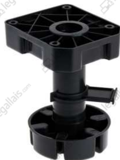
Pied + embase + clips à visser