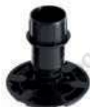
Haut. 80 mm