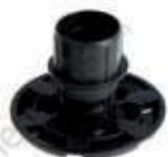
Haut. 50 mm