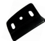
Pour bâti prof. 24 mm