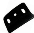
Pour bâti prof.24 mm