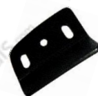
Pour bâti prof.24 mm