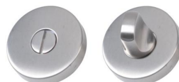
Condamnation sans voyant