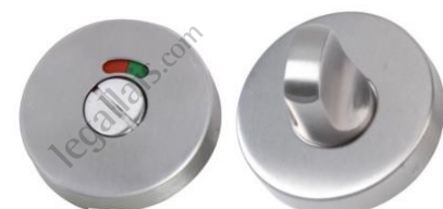
Condamnation avec voyant