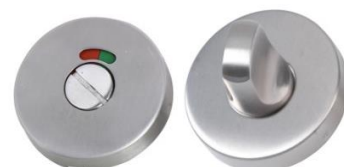
Condamnation avec voyant