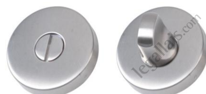
Condamnation sans voyant