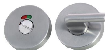
Condamnation avec voyant