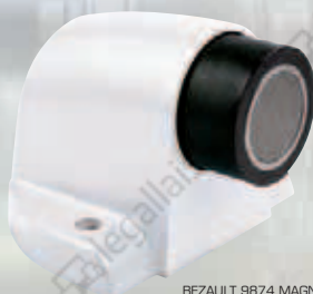
BEZAUPT 9874 MAGN Arrêt à ressort avec aimant et contre-plaque acier