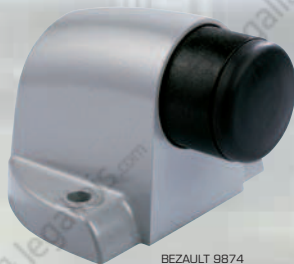
BEZAUPT 9874 Butée à ressort