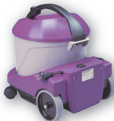
Enrouleur automatique de câble