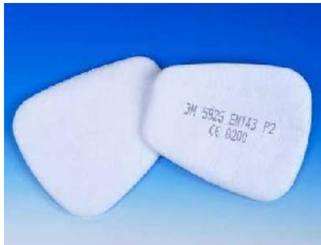
Filtres antipoussières, fixation à baïonnette.